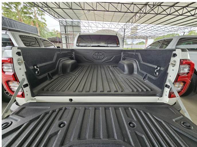
การวินิจฉัย CP 2