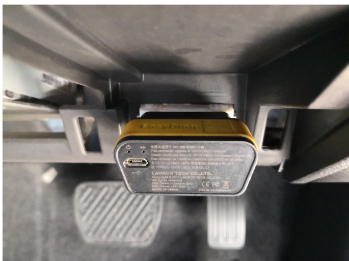
การวินิจฉัย CP 1