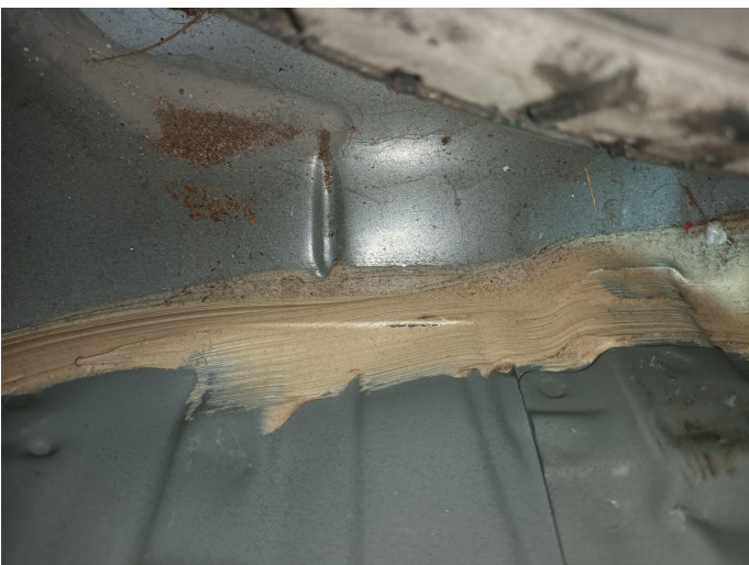
การวินิจฉัย CP 1